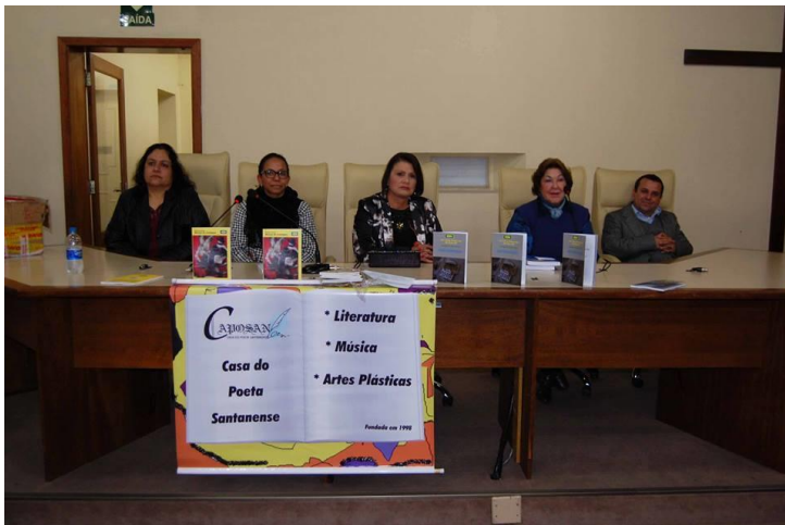
Lançamento do livro Antologia de contos e poesias