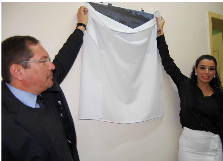
Inauguração da Galeria Permanente de fotografias históricas paisagísticas