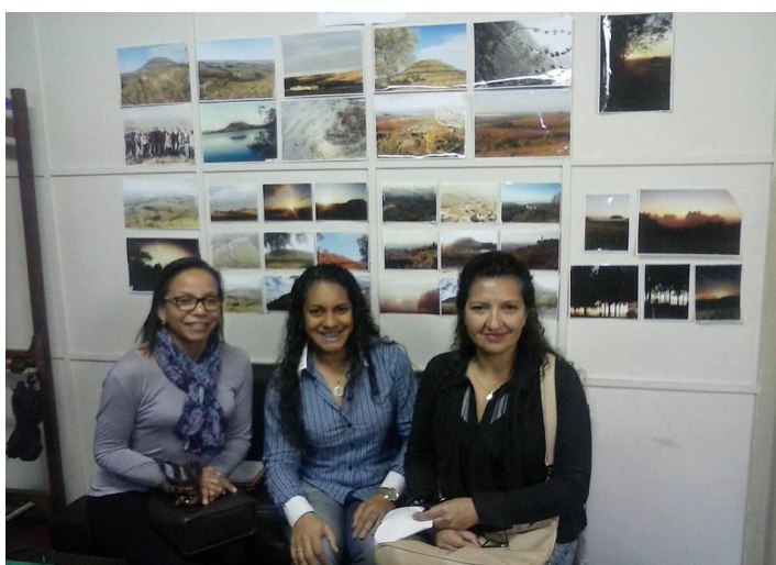
Avaliação dos trabalhos na SME

POSTAGENS NO FACEBOOK – Publicação Criação da Alfândega; Vídeo da TV Cidade 10; Visita do Pesquisador Marlon Asséf; Publicação A Visita da Imperador; Visita orientada Escola Pacheco Prates; Publicação Inauguração do Quartel do 2º Regimento da Brigada Militar; Publicação Iluminação Pública; Exposição dos trabalhos das Escolas Municipais participantes do Projeto “Sant’Ana que Carrego no Peito”.