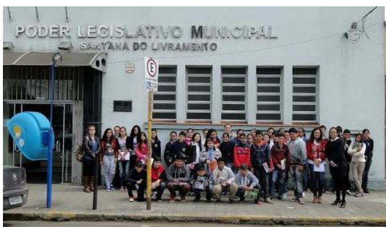
Visita Orientada da Escola Pacheco Prates

NOVEMBRO DE 2015 - Reunião na Secretária Municipal de Turismo pela participação do Memorial Ivo Caggiani na Semana da Consciência Negra; Pesquisa e organização sobre os legisladores negros da Câmara de Vereadores de Sant'Ana do Livramento; Organização de arquivos documental da gestão política do Município e da Câmara de Vereadores ( recortes de jornais)