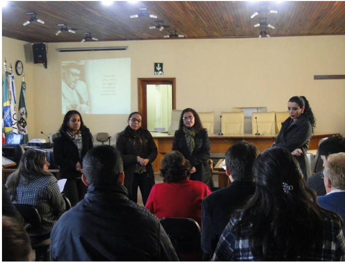
Apresentação do Projeto Sant'Ana que carrego no peito