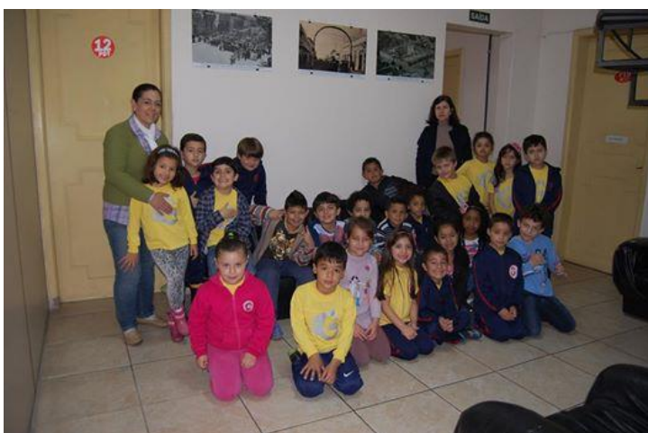
Visita orientada da Escola General Neto participando da 9ª Primavera dos Museus

OUTUBRO DE 2015 – Memorial Ivo Caggiani visita Secretária Municipal de Educação para avaliação de trabalhos do Projeto “ Sant’Ana que Carrego no Peito”; Entrega da premiação para os vencedores do concurso “ Sant’Ana que Carrego no Peito”.