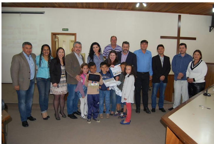
Entrega da Premiação do Projeto Sant'Ana que Carrego no peito